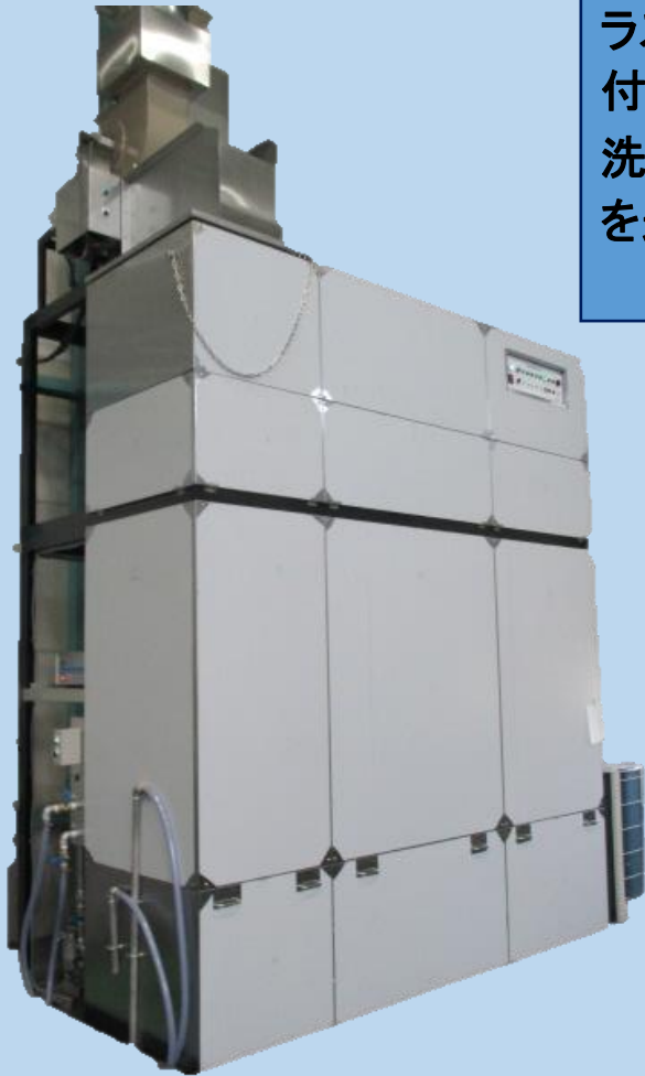
<トリクロロエチレン洗淨装置>

ラス加工やパンチング加工など様々な工程で付着する油汚れの洗淨(加工油の脱脂)が可能。 洗淨力の強力な トリクロロエチレン洗淨装置 を追加ラインアップ！！